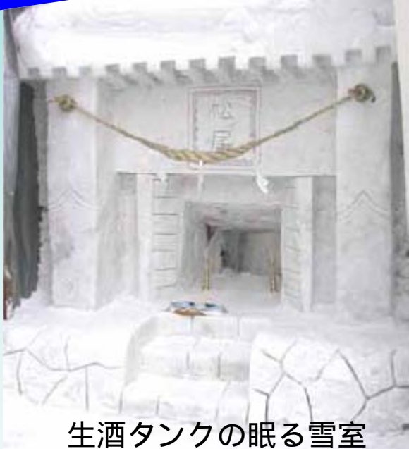
生酒タンクの眠る雪室