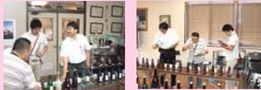
酒質を確かめる「呑み切り」

日本酒度 +3.0~+5.0 酸度 1.1~1.3 アミノ酸 0.7~0.9 使用酵母 自社保存株 アルコール分 16.0~16.9 精米歩合 35% 原料米 山田錦100%