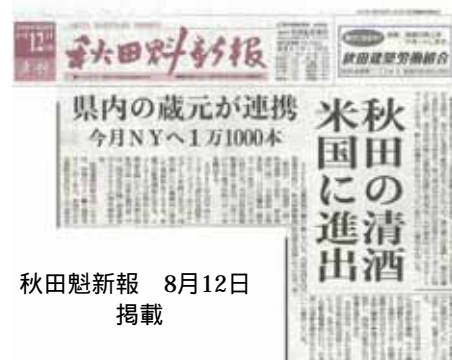
秋田魁新報 8月12日 掲載

昨年は輸入元となるWINEBOW BRANDS INTERNATIONAL社の社長を秋田にお招きし、蔵で利き酒をしたり、我々が訪米しWINEBOW社の社員に酒セミナーを実施するなど、販売戦略を練りながら進めてまいりましたが、いよいよ9月の上旬には輸出第一便がNYに上陸する予定です。(天寿の商品は純米吟醸の鳥海山で、冷蔵コンテナで輸送されます)