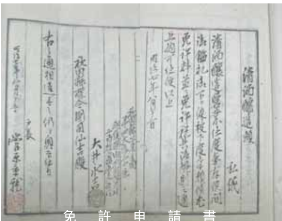
申請書 許 免

清酒醸造願 清酒醸造営業仕度奉存候間、御鑑札御下ケ渡被下度奉候、尤、免許料並二免許税共、御規則之通上納可仕候、以上