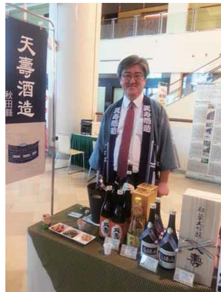
↑Citysuper 台湾にて（平成25年4月14日）

それなのに減反政策はそのまま継続、現況が見えていないのか米が足りない今も備蓄米買い上げへの執着を改めないのでは無いのでしょうか？ これをどうにかして、地方の衰退した東京もまた活力が急激に落ちるのではないのでしょうか？ 日本酒の業界は長年値上げをしておりません。これは長期にわたる売り上げ不振の弱気と米価の下落による原価低減のお蔭でした。しかし、加工用の玄米でさえ過去二年で一俵（60kg）3,000円上がりが、来年は少なくとも2,000円は上がる事が確定しています。三年で一俵5,000円の値上げ・電気・重油の値上げに加え、アベノミクスのインフレ狙いに日本酒業界は耐えられないのではないかと考えます。 定価販売をやらぬ大手・低価格蔵以外では、値上げの話が出てきており佐賀県では既に値上げを実施いたしました。値上げが有るとすれば、これまでの大手主導型から地方酒蔵主導型になるのではと考えます。 弊社もコストアップと高温障害原料米の酒化率の悪化に溜息をついて